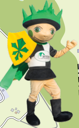
Bycio herbu Kasztan oficjalna maskotka gminy Bytów